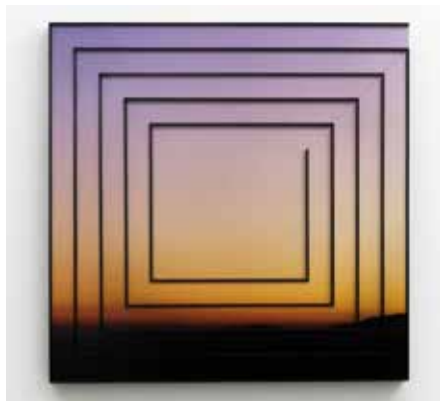
La dernière Levée , 2014, photographie argentique couleur et bois. Collection particulière.

Galerie In Situ Fabienne Leclerc 19 rue Michel Le Comte Paris 3 e du 23 janvier au 12 mars