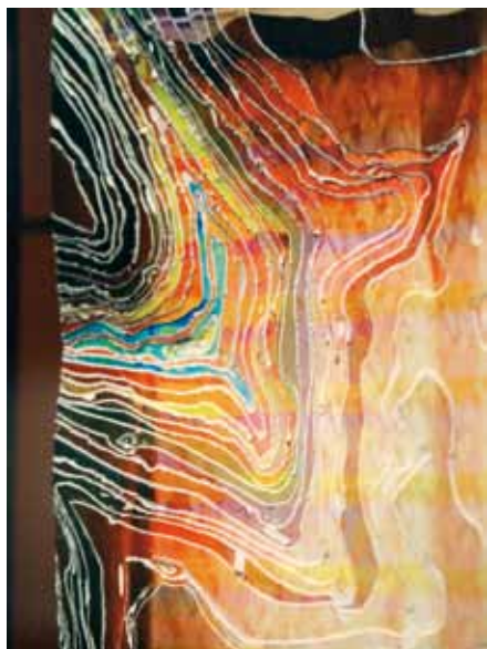
La 25ème image , 2010, vingt-quatre tirages laser plastifiés, contrecollés, creusés, dans boîte plexiglas. Collection particulière.

«Je choisis des sujets qui peuvent réunir par analogies différents espaces : la photographie, le photographié et le photographique » déclare-t-elle en préambule de notre rencontre.